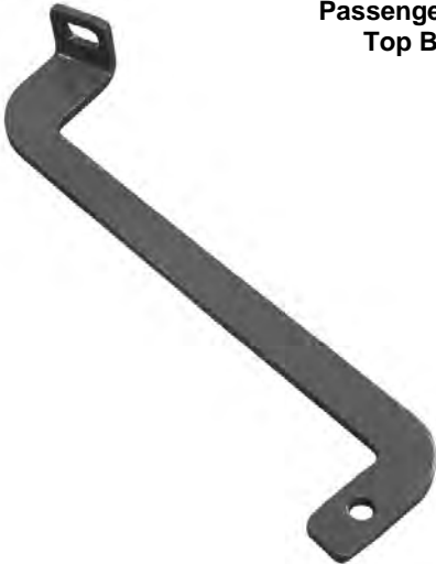
Passenger Side Top Bracket