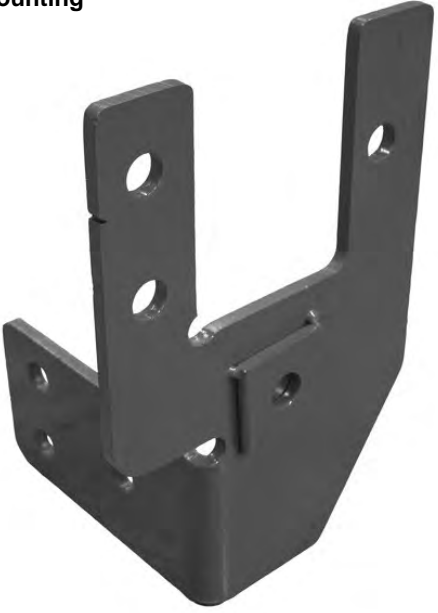
Driver Side Mounting Bracket