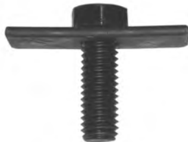
10mm x 30mm Bolt Plates